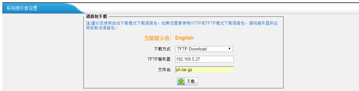
图 2-2 TFTP 上传