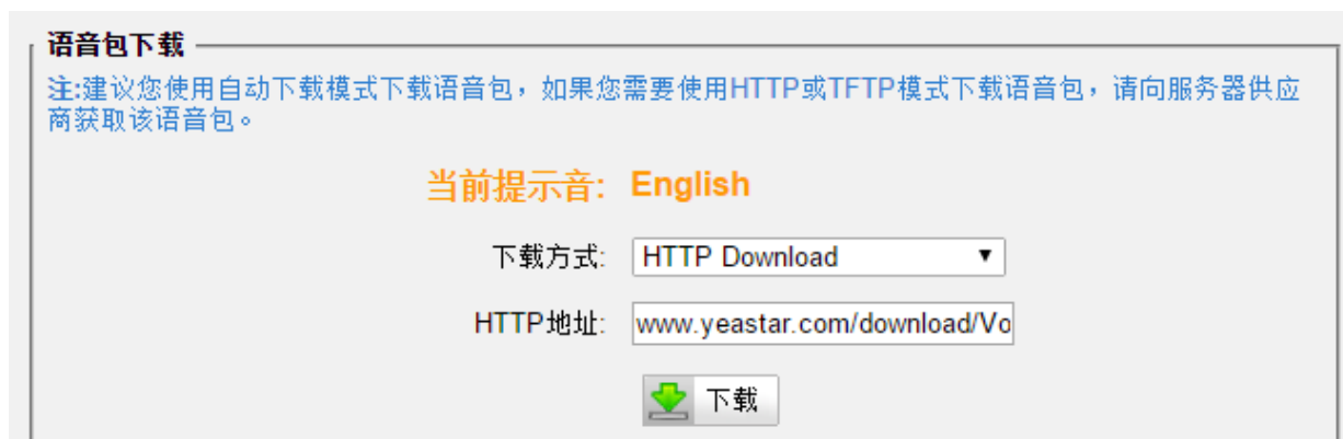
图 1-2 HTTP 下载

www.yeastar.com/download/VoicePrompts/NeoGate/zh.tar.gz