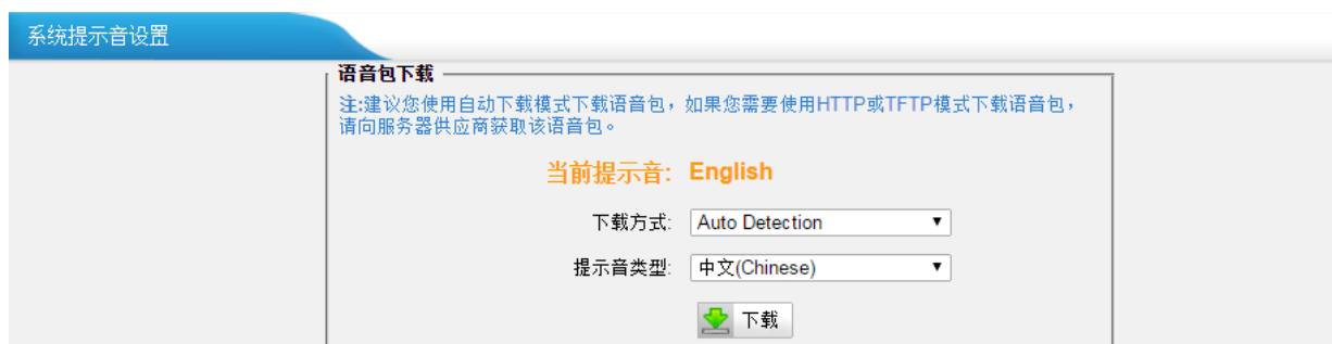
图 1-1 自动模式

选择下载方式为“Auto Detection”的方式，即自动模式，然后选择您需要的提示音类型，点击“下载”，系统将自动下载您选择的提示音，下载成功后旧的系统提示音直接被替换成新的提示音。